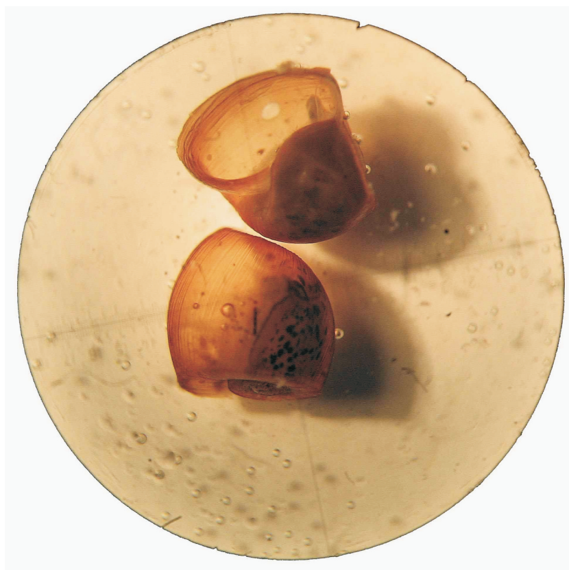
2. Внешний вид моллюска рода Planorbella .

жительно, рода Planorbella Haldeman, 1843 (рис. 2). На этих же участках (в подводном канале на глубине до 2 м) моллюски регистрировались и в сентябре 2008 г. Эти моллюски распространены в водоемах Флориды (США), могли распространиться благодаря аквариумистам. Учитывая специфический термический режим, можно предположить их натурализацию в водоеме.